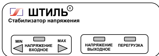
Рисунок 4.1 Передняя панель стабилизатора

На одной боковой стенке стабилизатора расположена розетка с заземляющим контактом для подключения нагрузки, а на другой – автоматический предохранитель 2А (у стабилизатора R250ST) или 5А (у стабилизаторов R400ST, R600ST), или 10А (у стабилизатора R800ST), выключатель СЕТЬ и выведен сетевой шнур для подключения стабилизатора к сети.